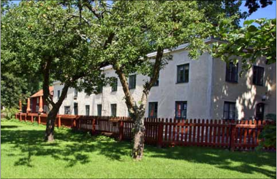
Pilgrimscentrum i Vadstena med bokcafé, kontor och gästhem. Här är under syns Klosterleden genom Vadstena.